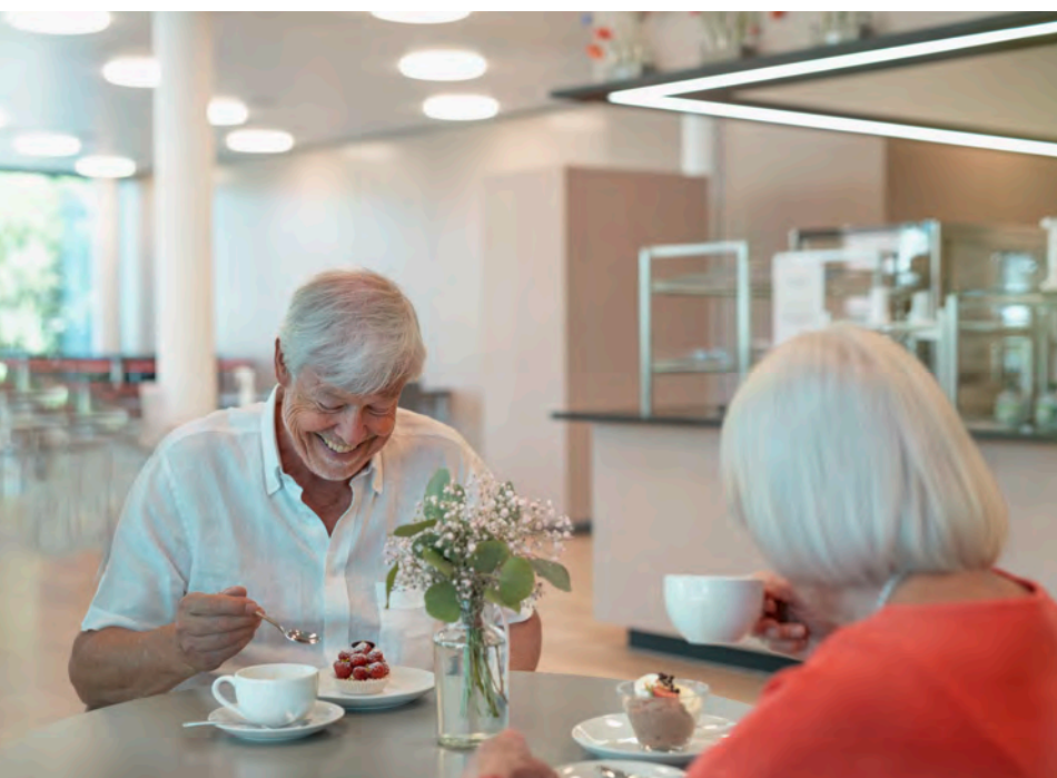
Unser gemütliches Lindenkafi

Unser Lindenkafi lädt unsere Bewohnerinnen und Bewohner, ihre Angehörigen, unsere Mitarbeitenden sowie alle Besucherinnen und Besucher zum Geniessen und Verweilen ein. Hier kann gemütlich miteinander geplaudert, gelacht oder gefeiert werden. Bei grösseren Anlässen bietet unser angrenzender Lindensaal viel Raum für spezielle Feste.