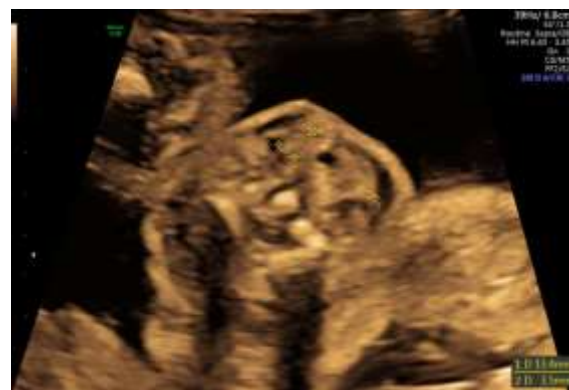
Fetale Schilddrüse 22. SSW